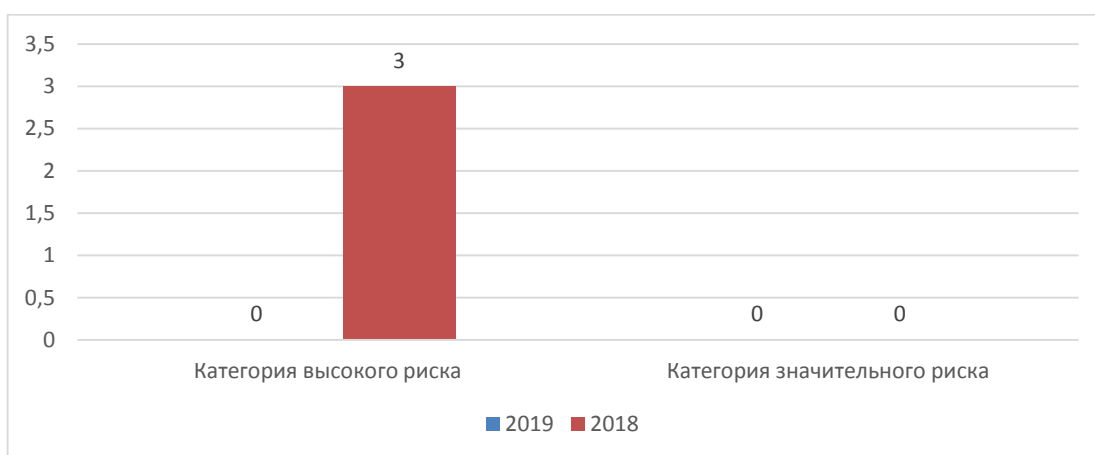
Рисунок 1. Распределение нарушений требований по категориям рисков

Распределение количества проверок объектов надзора по категориям рисков на территории Забайкальского края приведено на рисунке 2.