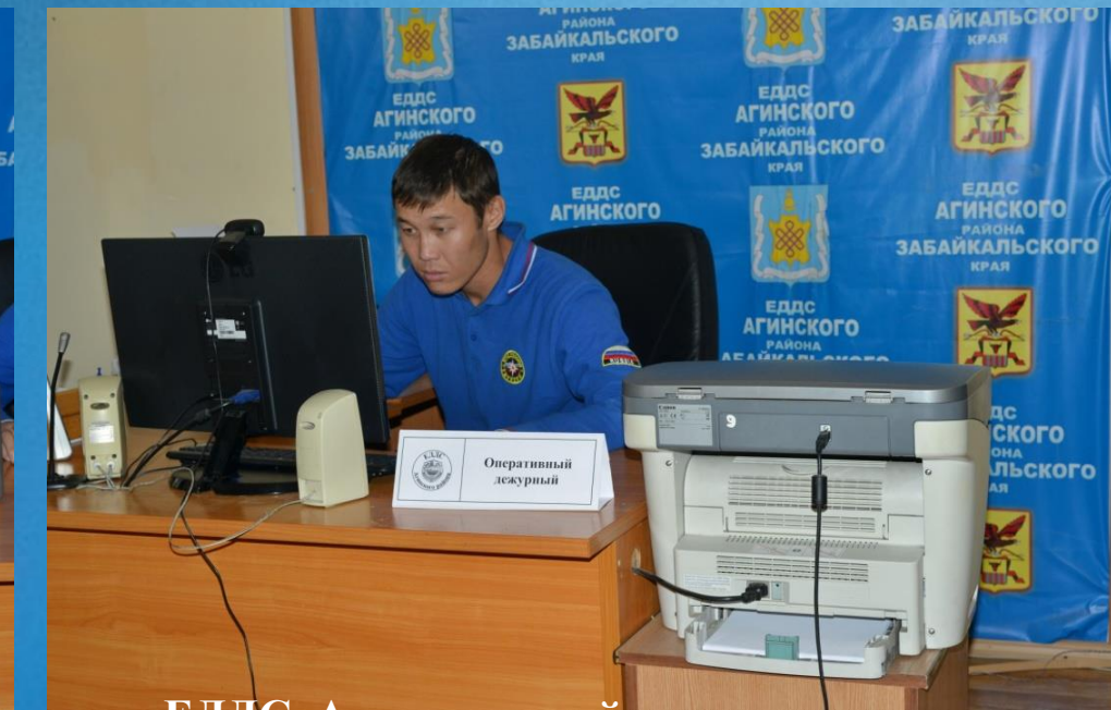
Комната оперативного дежурного ЕДДС Агинского района