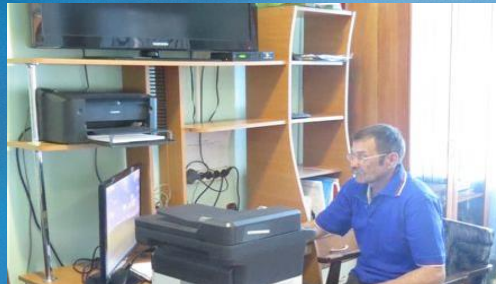
Комната оперативного дежурного ЕДДС ГО г. Петровск-Забайкальский